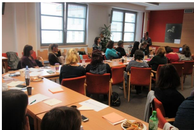
Obrázek č. 2: Setkání k tématu Možnosti posilování rodičovských kompetencí v síti v Královéhradeckém kraji, 17. 1. 2019

nastavení spolupráce mezi poskytovateli služeb a OSPOD, o možnostech mateřských a rodinných center v rámci posilování rodičovských kompetencí atp.