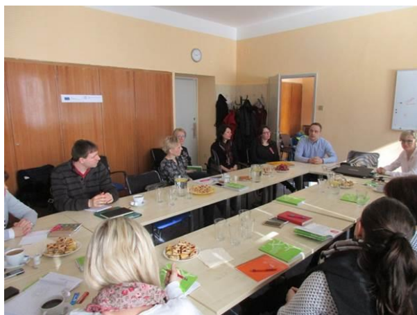
Obrázek č. 3: První Intervizní setkání vedoucích OSPOD v Královéhradeckém kraji, 21. 3. 2018