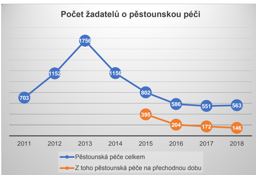
Graf č. 2

Od roku 2016 však dochází ke stagnaci počtu žadatelů o svěřeni dítěte do pěstounské péče (viz graf č. 2). Pro děti, které jsou nuceny opustit z různých důvodů péči vlastních rodičů, je tak obtížnější nalézt vhodné řešení v rodinném prostředí. Z tohoto důvodu je nutno provést revizi stávajícího systému dávek pěstounské péče, odborné podpory výkonu náhradní rodinné péče a některých dalších záležitostí.