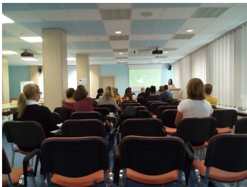
Spolu a včas ohroženým dětem, 1. 11. 2018, Zlín