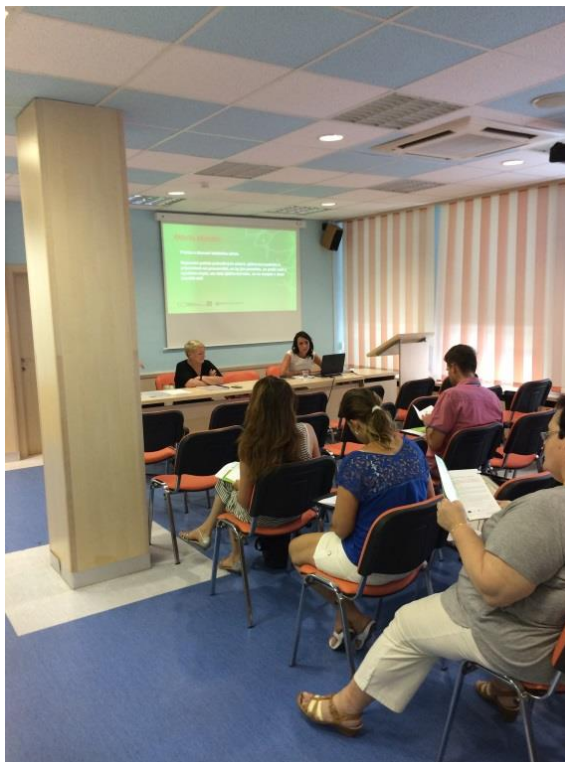
Spolupráce orgánu sociálně-právní ochrany dětí a základních škol, 1. 6. 2018, Zlín

V současné době se krajská síťarka připravuje na realizaci dalšího setkání, které bude orientováno na včasnou identifikaci ohroženého dítěte ve škole. Jedním z témat, které zde bude otevřeno, je také zřízení sociální práce ve školách. Škola je často místem, kde dochází k identifikaci problému dítěte a na tuto skutečnost je nutné včas a efektivně reagovat. Oslovení ředitelů či jiných zástupců škol prostřednictvím právě tohoto setkání by tak mohlo vést k rozšíření jejich povědomí o školské sociální práci, možnostech jejího zřízení a především přínosu v podobě včasného zachytu problémové situace dítěte. Krajská síťarka v rámci tohoto setkání usiluje o účast okresního metodika prevence pedagogicko-psychologické poradny, který je myšlenku zřízení sociální práce ve školách schopen smysluplně šířit a efektivně zacílit směrem k ředitelům škol.